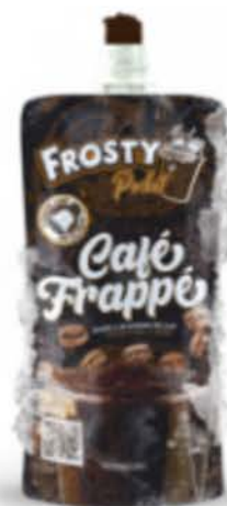
Café Slushie Frappé instantané