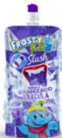
Saveur Slushie Dracula instantanée (cola, vanille et fraise)