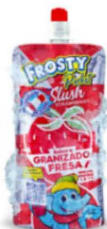
Saveur fraise Granité instantané

À vendre sur n'importe quelle étagère, sans avoir besoin de réfrigération