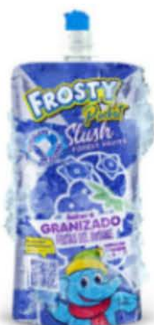
Barbotine instantanée au goût de fruits des bois