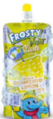
Granité instantanée au goût de citron